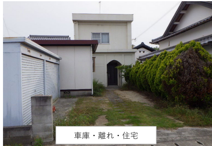
車庫・離れ・住宅