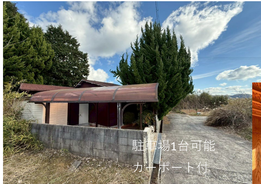
駐車場1台可能 カーポート付